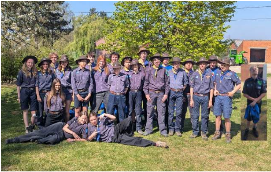
Uw verslaggever ter plaatse Tactische Gekko

Ik wil de Stam bedanken voor het lekkere eten en de leiding voor het de goede voorbereidingen die het kamp hielpen goed te verlopen. Het was echt een topkamp!